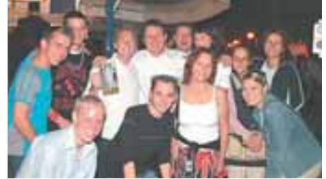
Wichtig für jeden Politiker der was auf sich hält. Eine Leistungsstarke Fotocrew wie die der Firma Bleyl

Öffnungszeiten: täglich von 8.00 - 3.00 Uhr