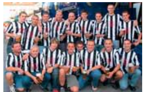
Da wird der ATS Kulmbach aber neidisch. Schaut her, wieviel Spieler wir haben. FC Hohenberg, das Team

Fragen kostet nichts. Nicht fragen vielleicht schon.