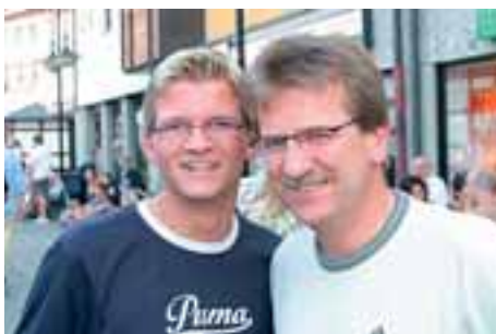
Brille - Fielmann!!!