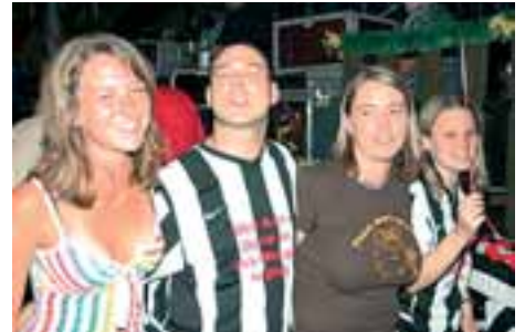
Am besten oben ohne bräunen lassen - kleiner Tipp für die Zukunft

Fotos vom Bierfest finden Sie unter www.kulmbacher-land.com und unter www.bierfestzeitung.de