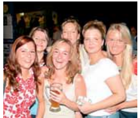
Eine Truppe gackernder Hühner. Gacker, gacker, gacker.....