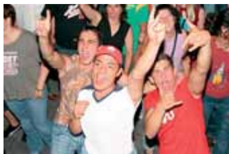
Die Kung Fu Fighting Gang