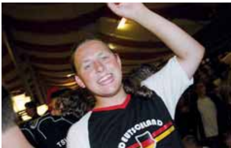
Olé, Olé, Olé, Super Deutschland ... die Stadl-Hymne