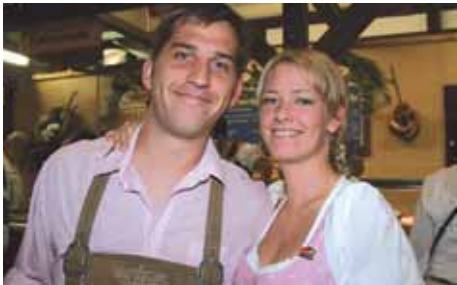
Dirndl und Tracht, so solls sein...