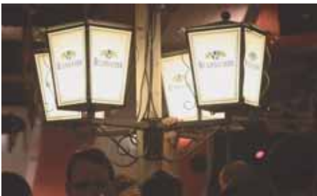
Das KULMBACHER Licht brennt immer