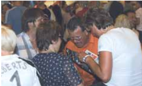
Bierfest-Horoskop. Ich bin Waage! Was bist Du?