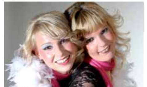
Scharfe Bilder von Ihrer Digitalkamera gibt es jetzt aus dem neuen Laserlabor bei Foto Bleyl Mehr Info's unter www.BLEYL.com