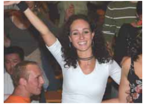
„Der weiße Riese“ ...winke winke