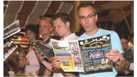
Dunnerwetter! Mei Horoskop ist ober fetzig.