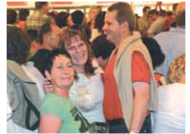
Petra freut sich, manchmal hat man auch etwas Glück