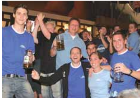
Die junge Union im Siegestaumel