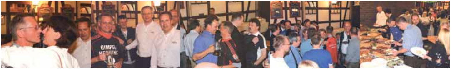
GH-Party im Zelt