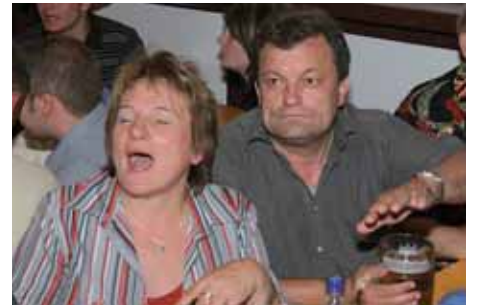
Homm alles - konnst weiter geh"