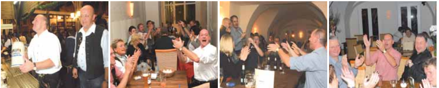
BARIM, BARIM, BARIM ..... Erstes Obergeschoß.....

Fotos vom Bierfest finden Sie unter www.bierfestzeitung.de