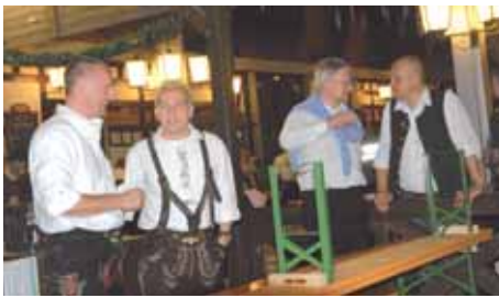
Nach getaner Stadl-Arbeit - denn jetzt beginnt erst die richtige Arbeit im Nachleben