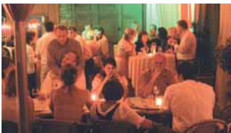
Bei Ermano im Alla Rustica gibt's Gutes italienisches!