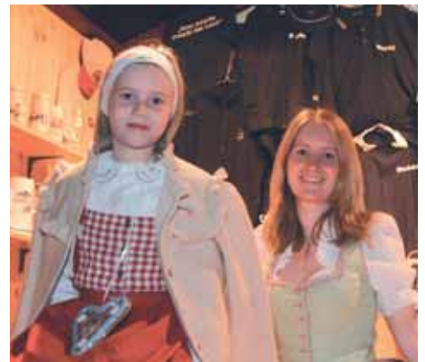
Die Muggenburg's Madla im Fan-Shop