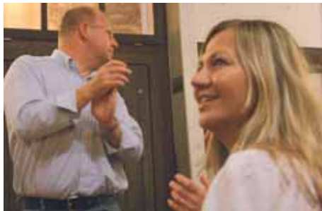
Der Graf kann gar nimmer hie schaua - erster Antialkoholiker im Stadl