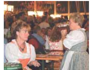
Auch „Schnapsfrauen“ brauchen mal einen anderen Stoff