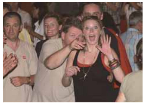
„Schau da ist die Kamera für die Bierfestzeitung!“