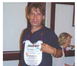
Hallo Taxi! Ich bin der Hasi aus Unter- steinach und muß ins Deutsche Haus.