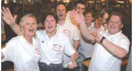
Landgasthof Friedrich aus Trebgast