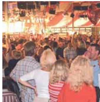
„Woidarawöll“ heuer zum ersten Mal dabei