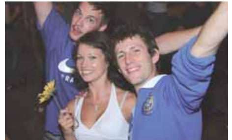
„Wer von den beiden Jungs wird wohl mein Ritter?“