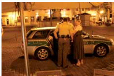
Schon Al Capone sagte: "Mit einem freundlichen Wort und einer Waffe erreicht man mehr, als mit einem freundlichen Wort allein!"