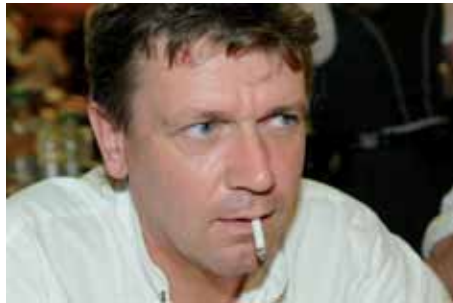
"Wir haben nichts dagegen, dass "Sie" rauchen, aber bitte nicht ausatmen!"