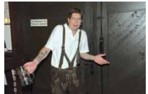
So ein Pech, jetzt ist die Türe zu! Wie komm ich hier wieder raus?